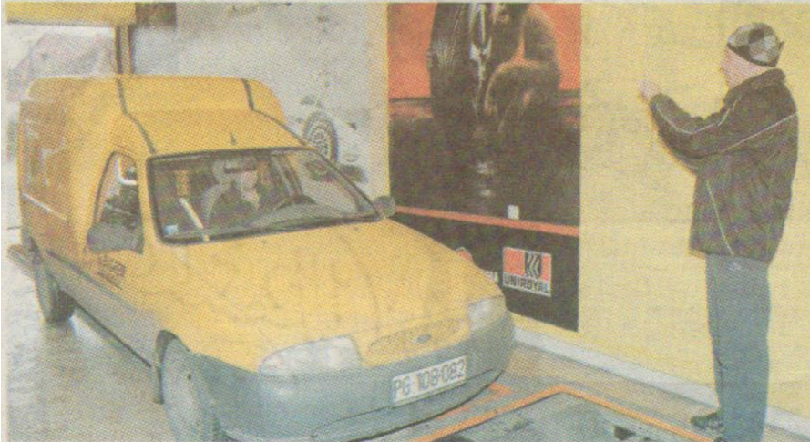
Osiguranje poskupilo i prije osam mjeseci: sa tehničkog pregleda

Cijene premija osiguranja za vozila posljednji put su promijenjene u septembru prošle godine, kada su, zbog ukidanja bonusa R10-30 za sve tarifne grupe, povećane oko 30 odsto.